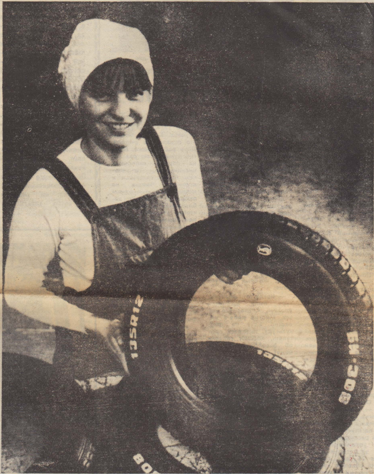
«Обувь» для малолитражных автомобилей «Ока» начало выпускать производственное объединение «Бобруйскишина». В этом году работники объединения изготовят десять тысяч шин